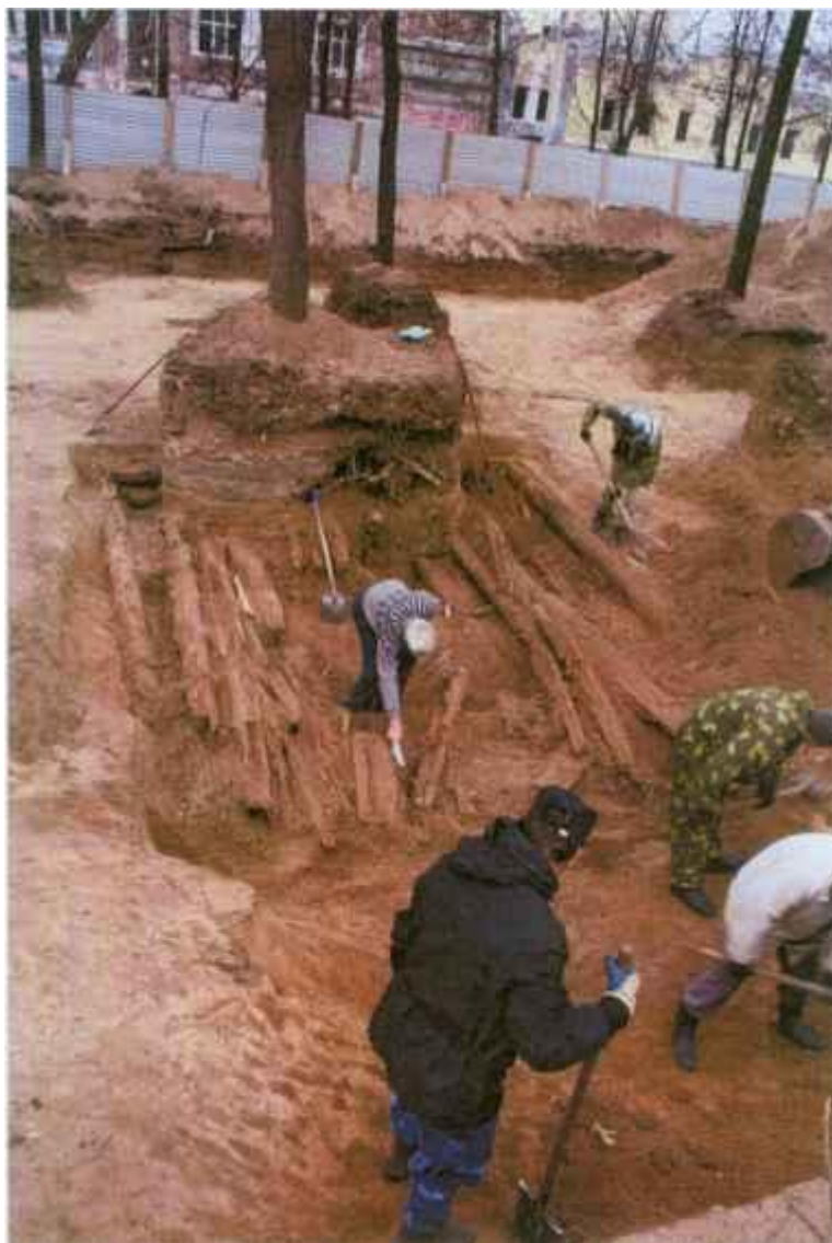
Рис. 7. Раскоп III. Расчистка постройки конца XVIII - начала XIX вв. Вид с юго-востока.