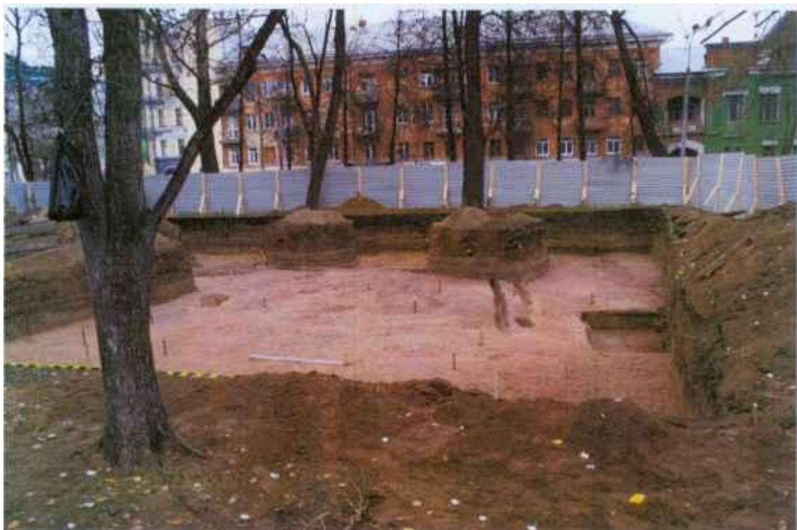
Рис. 12. Выбранный раскоп IV. Вид с юго-востока.