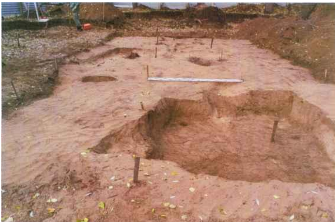
Рис.4. Выбранный сектор раскопа I. Вид с юго-востока. Видны остатки мусорной ямы конца XIX в.