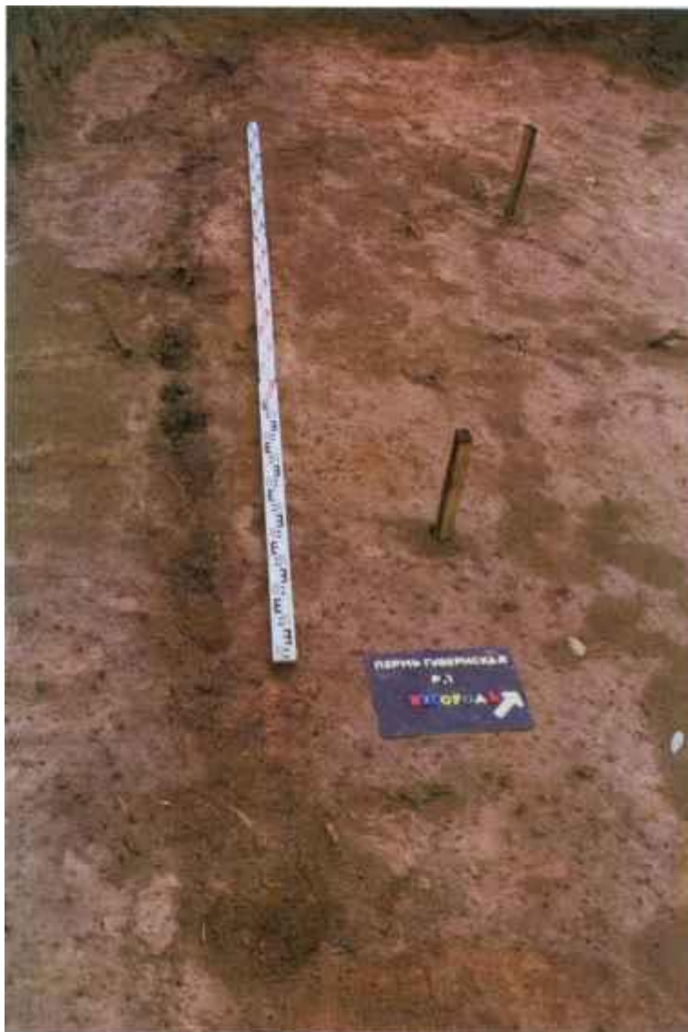
Рис.2. Фрагмент изгороди XVIII в., зафиксированной под слоем пожара 1842 г. в раскопе I. Вид с юго-востока.