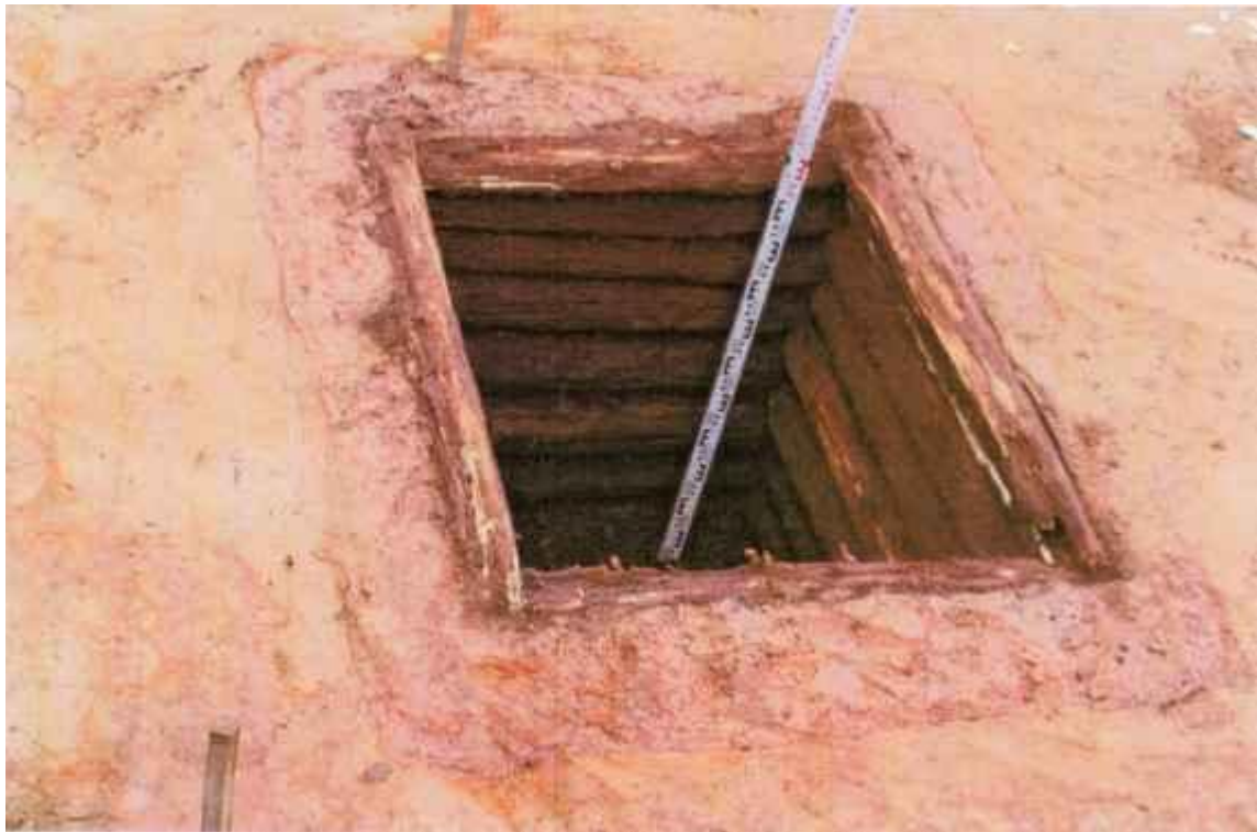
Рис.11. Раскоп IV. Колодец. Вид с юго-востока.