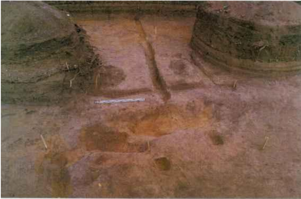
Рис.9. Раскоп IV. Остатки изгородей XVIII в. Вид с юго-востока.