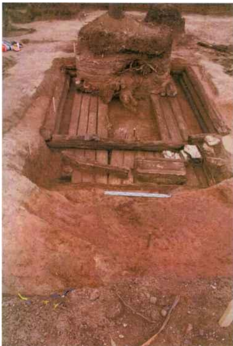
Рис.8. Раскоп III. Расчищенная постройка конца XVIII - начала XIX вв. Вид с юго-востока.