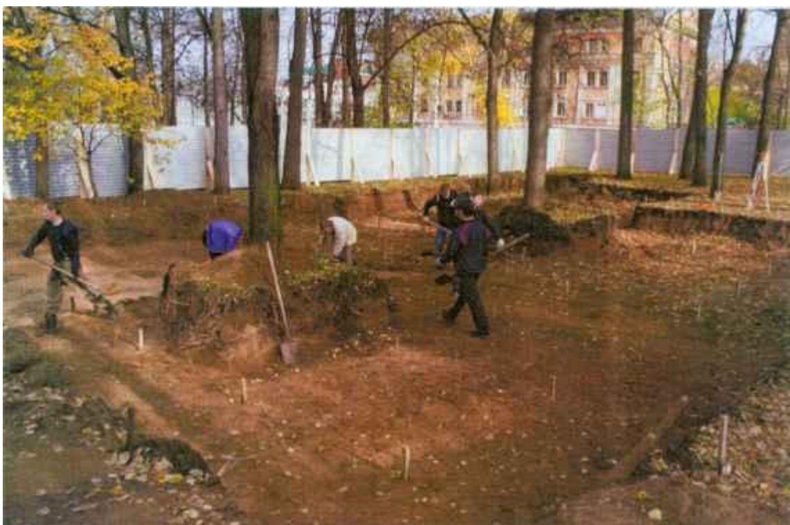
Рис.5. Расчистка раскопа II после снятия балластных напластований XX в. Вид с юго-востока.