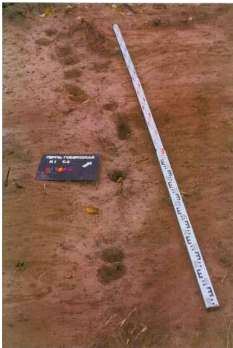
Рис.3. Выбранная изгородь XVIII в В раскопе I. Вид с юго-востока.