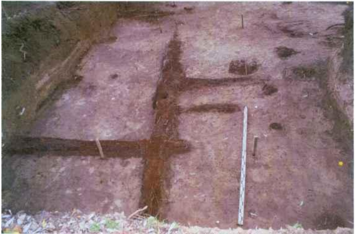
Рис.6. Раскоп III. Остатки торговых рядов 1805-1823 гг. Вид с юго-востока.