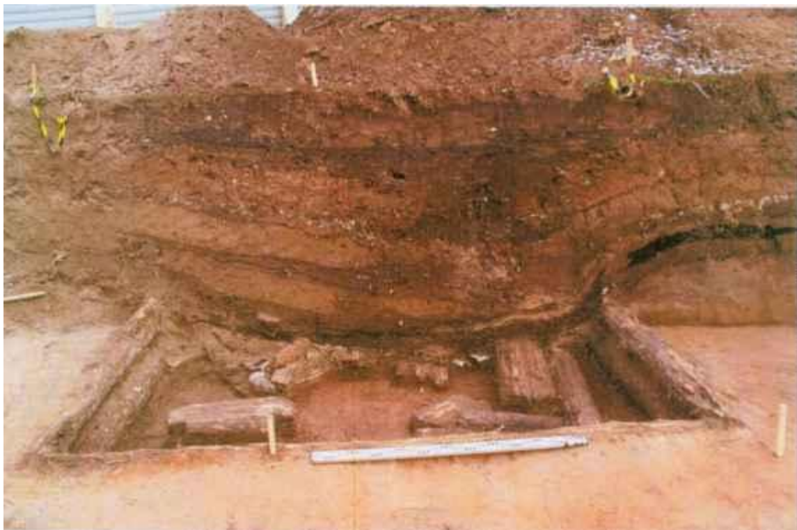
Рис.10. Раскоп IV. Остатки сооружения начала XIX в. Вид с юго-запада.